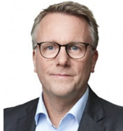
Morten Bødskov (S) Skatteminister og fungerende finansminister