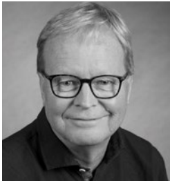
Ulrik Wilbek (V) Formand for KL's Socialudvalg og borgmester i Viborg Kommune